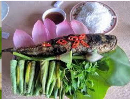
Cá lóc nướng cuốn lá sen non