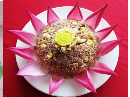
Cơm gạo huyết rồng