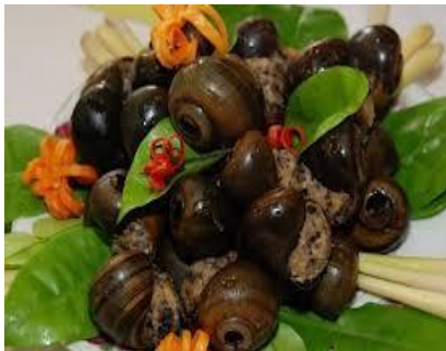
Ốc hấp tiêu