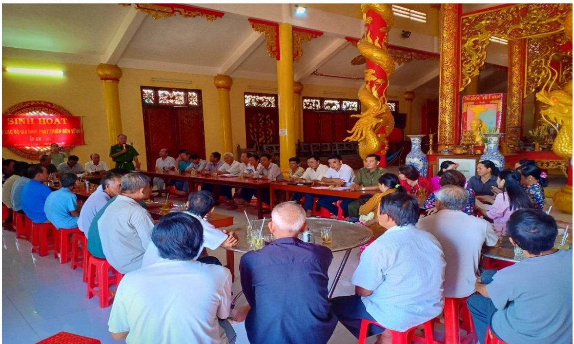
Sinh hoạt CLB “Gia đình phát triển bền vững” tại Đình Tòng Sơn, xã Mỹ An Hưng A, huyện Lấp Vò, tỉnh Đồng Tháp