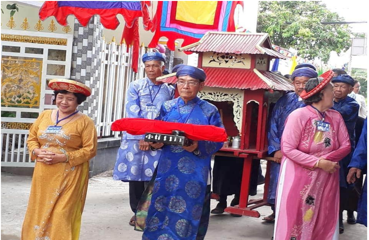
Lễ đón nhận Sắc Thần tại Đình thần Mỹ Thọ, thị trấn Mỹ Thọ, huyện Cao Lãnh, tỉnh Đồng Tháp

Hiện nay, phần lớn đình làng trong tỉnh thường duy trì tổ chức 02 lễ hội lớn trong năm là Hạ điền và Thượng điền. Do đó, để đáp ứng nhu cầu sinh hoạt tín ngưỡng dân gian của Nhân dân cần thiết phải phục hồi, nâng cấp các lễ cúng đình truyền thống khác như: Lễ Tam ngươn (03 ngày Rằm lớn: tháng Giêng, tháng Bảy, tháng Mười); Đưa ông Táo về Trời (23 tháng Chạp); Tết Nguyên đán (1 tháng Giêng); cúng Khai Sơn (7 tháng Giêng); tết Hàn thực (3 tháng Ba); tết Thanh minh (khoảng tháng Ba); tết Đoan ngo (5 tháng Năm); tết Trung thu (15 tháng Tám); Trùng cửu (9 tháng Chín); Trùng thập (10 tháng Mười)... và các lễ cúng khác riêng có của từng địa phương để thu hút người dân đến sinh hoạt tại thiết chế văn hóa quan trọng này.