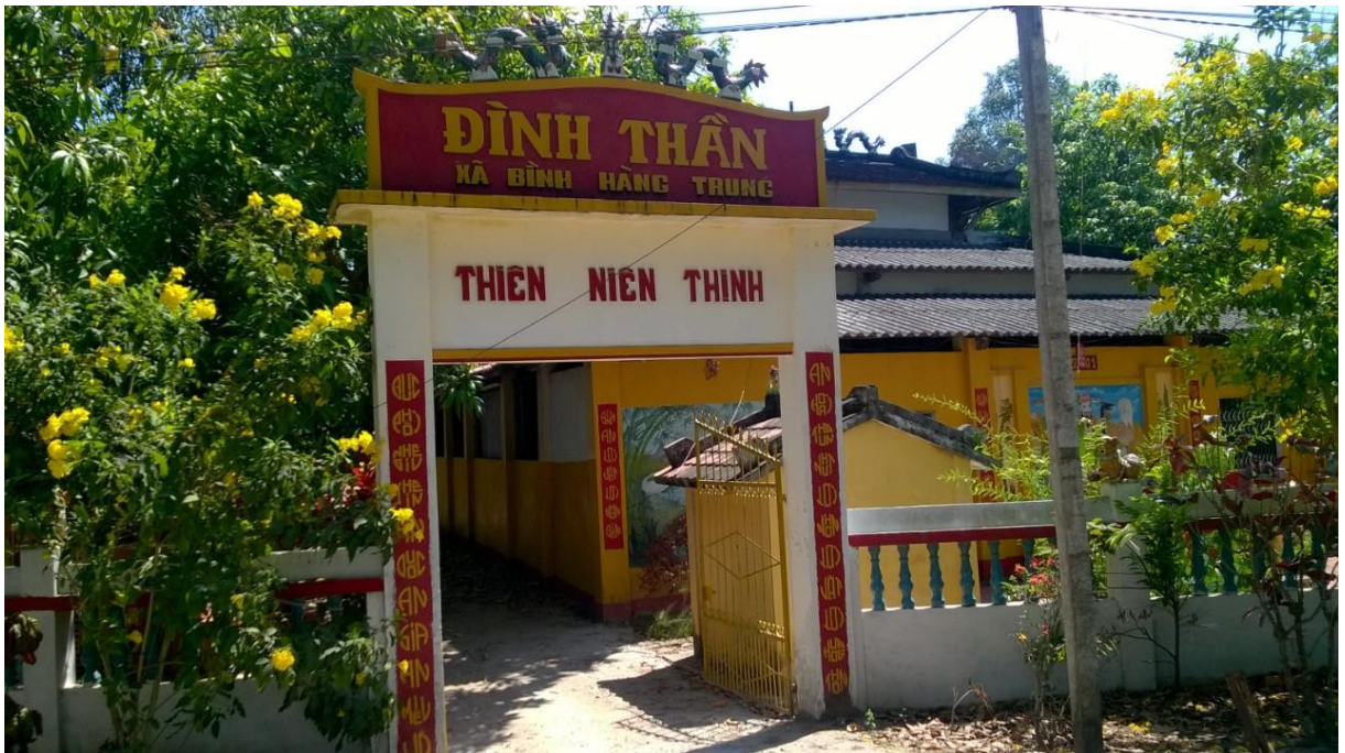
Đình thần Bình Hàng Trung Xã Bình Hàng Trung, huyện Cao Lãnh, tỉnh Đồng Tháp

Đình Tân Phú, Đình Tân Hòa, Đình Tân Thạnh (huyện Thanh Bình); Đình Mỹ Hội, Đình Trà Bông, Đình Bình Hàng Trung (huyện Cao Lãnh); Đình An Nhơn, Đình Mỹ Thạnh (thành phố Cao Lãnh); Đình Tân Xuân (huyện Châu Thành); Đình Phong Hòa (huyện Lai Vung); Đình Phú Thọ, Đình Phú Cường, Đình Phú Đức, Đình Phú Hiệp (huyện Tam Nông).