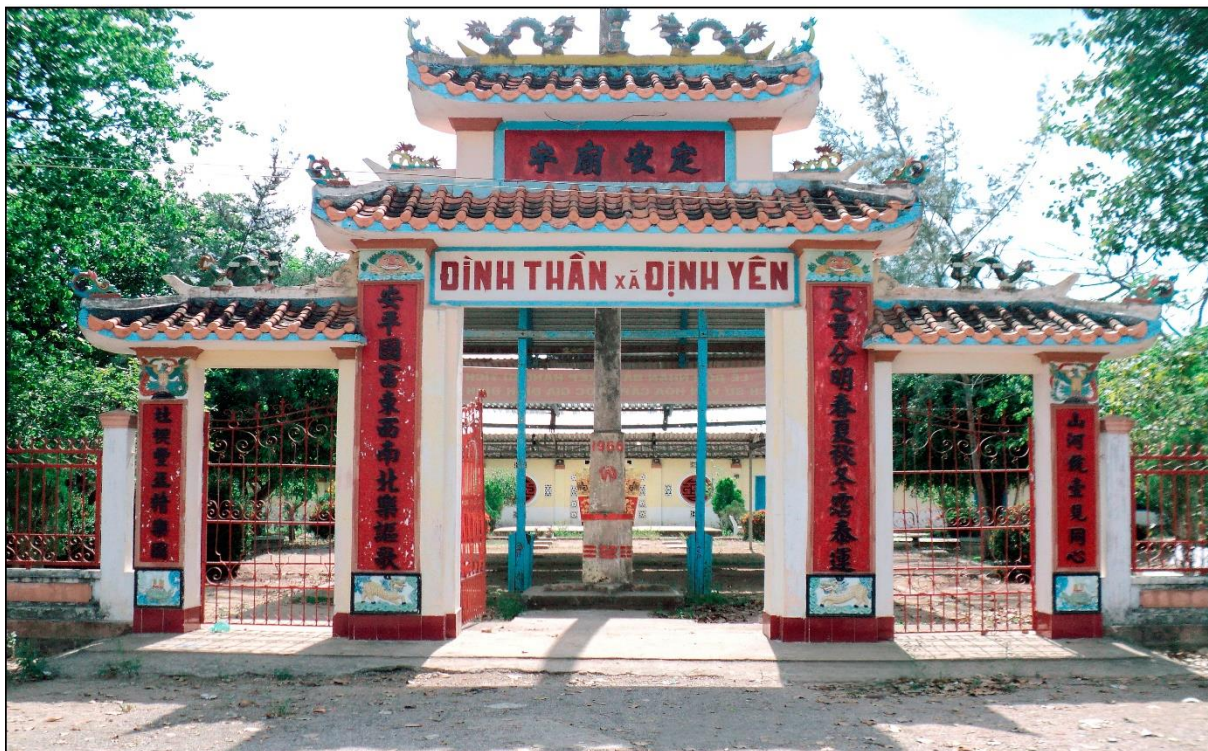
Di tích Quốc gia: Đình thần Định Yên Xã Định Yên, huyện Lập Vò, tỉnh Đồng Tháp