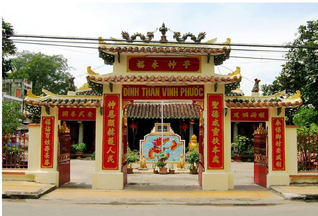
Di tích cấp Tỉnh: Đình thần Vĩnh Phước phường 1, thành phố Sa Đéc, tỉnh Đồng Tháp

Đình Tân An Trung, Đình Tòng Sơn, Đình Cai Châu, Đình Long Khánh, Đình Bình Thạnh Trung (huyện Lập Vò); Đình Vĩnh Thới – Tân Hòa, Đình Tân Dương (huyện Lai Vung); Đình thần Vĩnh Phước, Đình Tân Qui Tây (thành phố Sa Đéc); Đình Phú Thành A, Đình An Long, (huyện Tam Nông); Đình Tân