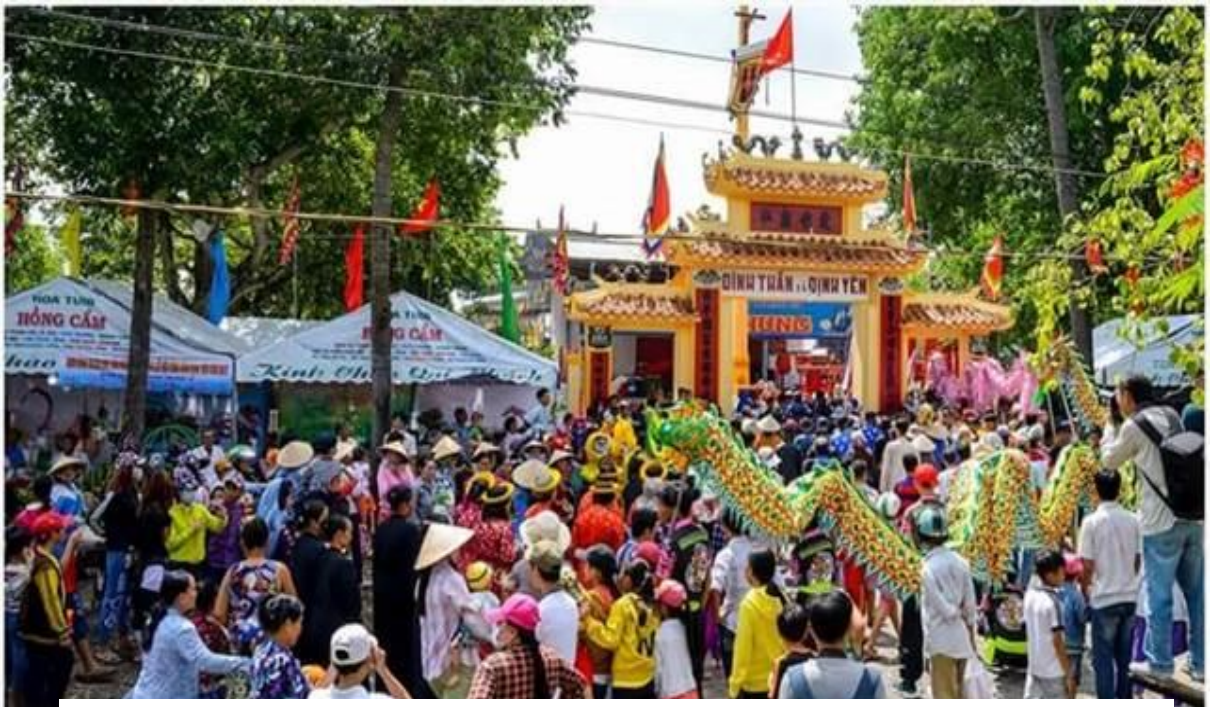
Lễ hội cúng Đình Định Yên, xã Định Yên, huyện Lấp Vò, tỉnh Đồng

Hiện nay, trong tổ chức lễ hội cúng đình hàng năm, Ban Tổ chức thường quan tâm nhiều đến “phần lễ” còn “phần hội” hình thức và nội dung có nhiều thay đổi, đơn giản hóa. Do đó, để phát huy chức năng sinh hoạt văn hóa trước tiên trong lễ hội đình làng cần thực hiện đầy đủ nội dung phần “hội”; đồng thời, lồng ghép thêm các hoạt động ngoại khóa “về nguồn”, giáo dục phổ biến kiến thức lĩnh vực di sản văn hóa cho học sinh, sinh viên; triển lãm tranh ảnh; trưng bày giới thiệu sách; hoạt động văn nghệ quần chúng (sinh hoạt câu lạc bộ đờn ca tài tử, câu lạc bộ hát với nhau, biểu diễn văn nghệ của Đội tuyên truyền lưu động); hoạt động thể dục thể thao (bóng chuyền, cầu lông, thể dục dưỡng sinh, cờ tướng...) vào các dịp lễ hội, ngày lễ lớn của đất nước và địa phương.