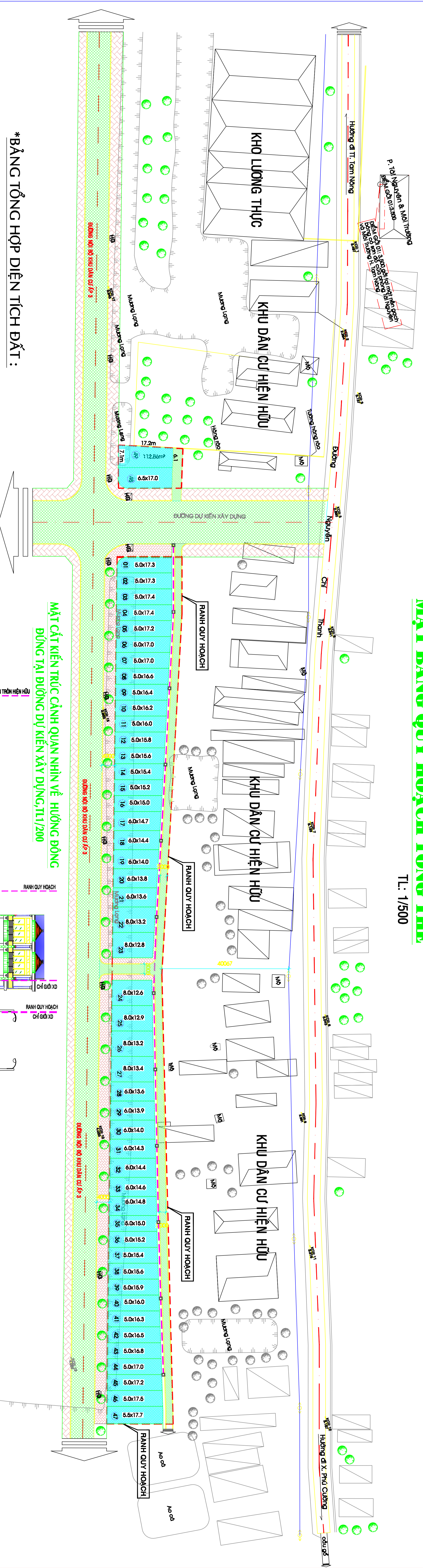
*BẢNG TỔNG HỢP DIỆN TÍCH ĐẤT: